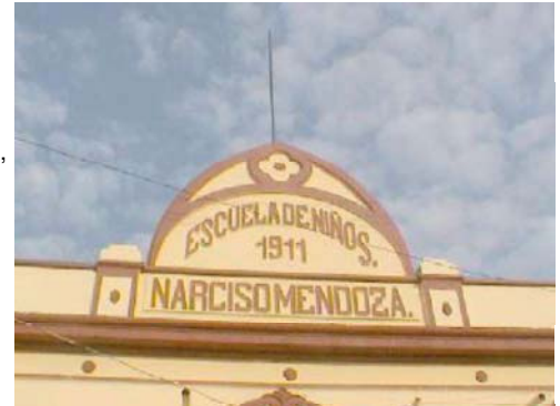
Detalle de interior o de fachada

Inmueble de fachada simétrica orientada al este, presenta siete vanos, seis de ventana de cerramiento en arco rebajado y al centro un acceso de cerramiento recto, todos con enmarcamientos de almohadillado; el muro tiene una altura de casi 6.00 m. con un remate semicircular e inscripciones en el centro. Su planta arquitectónica es paralela al perímetro del predio, cuenta con patio central y la conforman dieciocho locales que conservan su sistema constructivo de muros de adobe y pilares, se agregó un segundo nivel; los pisos son de loseta de vinil, los muros aplanados y la cubierta de bóveda catalana a base de vigüeta, petatillo y enladrillado. Conserva las características arquitectónicas típicas del Neoclásico del siglo XIX. Incluido en el proyecto de Declaratoria de Zona de Monumentos Históricos.