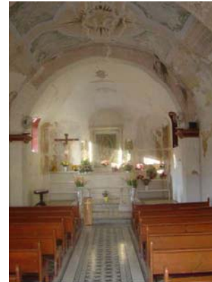
Detalle de interior o de fachada

Escultura religiosa, cuadro de la Virgen de Guadalupe.