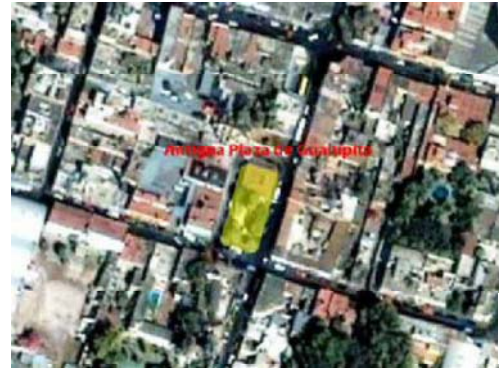
Croquis de planta