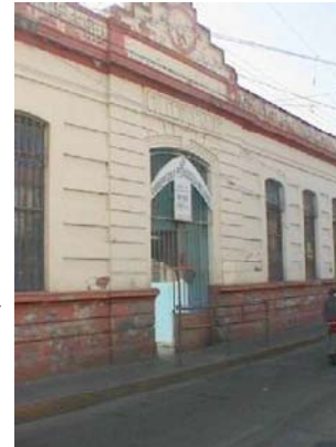
Detalle de interior o de fachada

Abrió sus puertas el 13 de abril de 1905, pero como un colegio de niñas, convirtiéndose así en la primera escuela oficial de la zona Oriente del estado. Inmueble ubicado en esquina de fachada principal orientada al Oeste, de catorce vanos, trece de ventana y uno de acceso, todos de cerramiento de arco rebajado, el pretil remata justo sobre el área de acceso con formas mixtilíneas simétricas y el muro es de casi 7.00 m. de altura con acabado de almohadillado. La planta arquitectónica es de formas rectangulares y patio central, se compone de más de diecinueve crujías, de pisos de cemento pulido, muros aplanados y cubiertas de concreto que han sido reforzadas porque estaban en muy mal estado. El inmueble conserva el estilo arquitectónico Neoclásico del siglo XIX. En el patio existe un busto con la imagen del Gral. Hermenegildo Galeana. Incluido en el proyecto de Declaratoria de Zona de Monumentos Históricos.