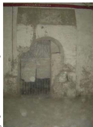
Detalle de interior o de fachada