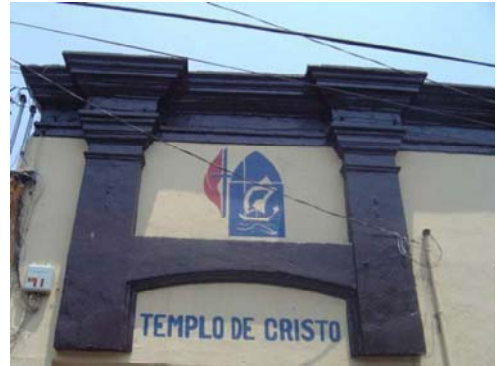
Detalle de interior o de fachada

Tiene pilastras prolongadas en el zaguán. Este inmueble tiene su fachada orientada al oeste y presenta tres vanos, uno de acceso y dos balcones, todos con cerramiento recto, los dos últimos conservan su remate escalonado y su herrería colada de forma circular. El acceso sufrió modificaciones que se aprecian en la fachada pues las pilastras que flanqueaban al original aparecen mutiladas; la fachada remata su muro con una cornisa. La planta es rectangular y la forman siete crujías y un patio lateral, ésta conserva elementos constructivos como pilares y arcos. Su cubierta es plana apoyada sobre vigas. Es una iglesia metodista y éste ha sido su uso desde el siglo XIX. Incluido en el proyecto de Declaratoria de Zona de Monumentos Históricos.