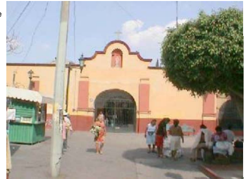
Detalle de interior o de fachada

Incluido en el proyecto de Declaratoria de Zona de Monumentos Históricos.