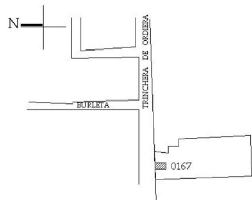
Croquis de localización