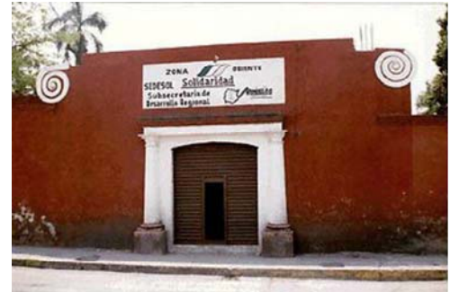
Detalle de interior o de fachada