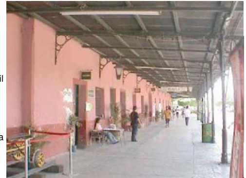
Detalle de interior o de fachada

Incluido en el proyecto de Declaratoria de Zona de Monumentos Históricos.