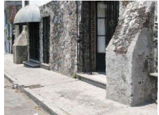
Detalle de interior o de fachada