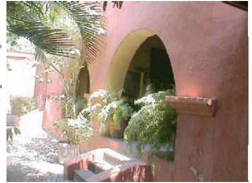
Detalle de interior o de fachada