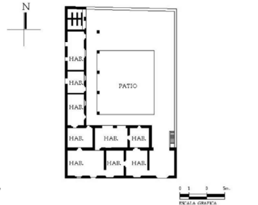
Croquis de planta